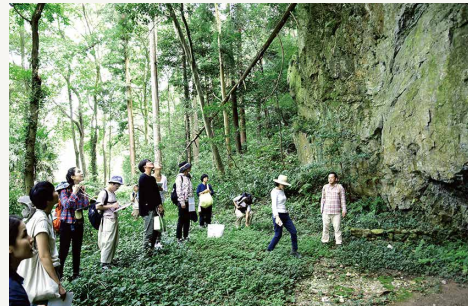
森を感じるツアー