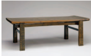
献梨と楓の拭漆卓