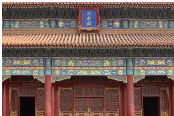
㊦〔中国〕故宮（紫禁城）太和殿

棟梁たちの「腕の見せどころ」の違いを際立たせながら、日中韓に脈々と受け継がれてきた棟梁たちの「ものづくりの心」にも迫ります。