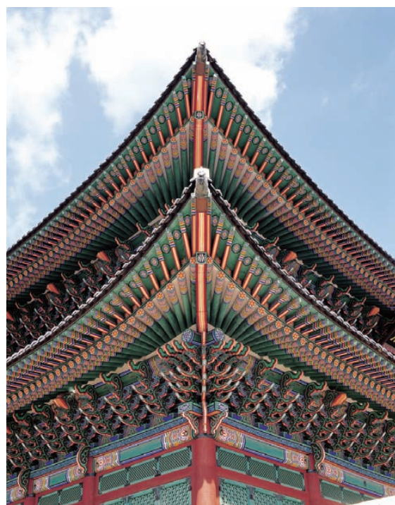
㊧〔韓国〕景福宮勤政殿