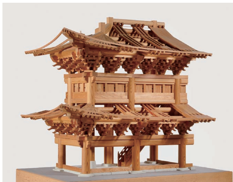
G 崇礼門（南大門）の構造模型、1/10