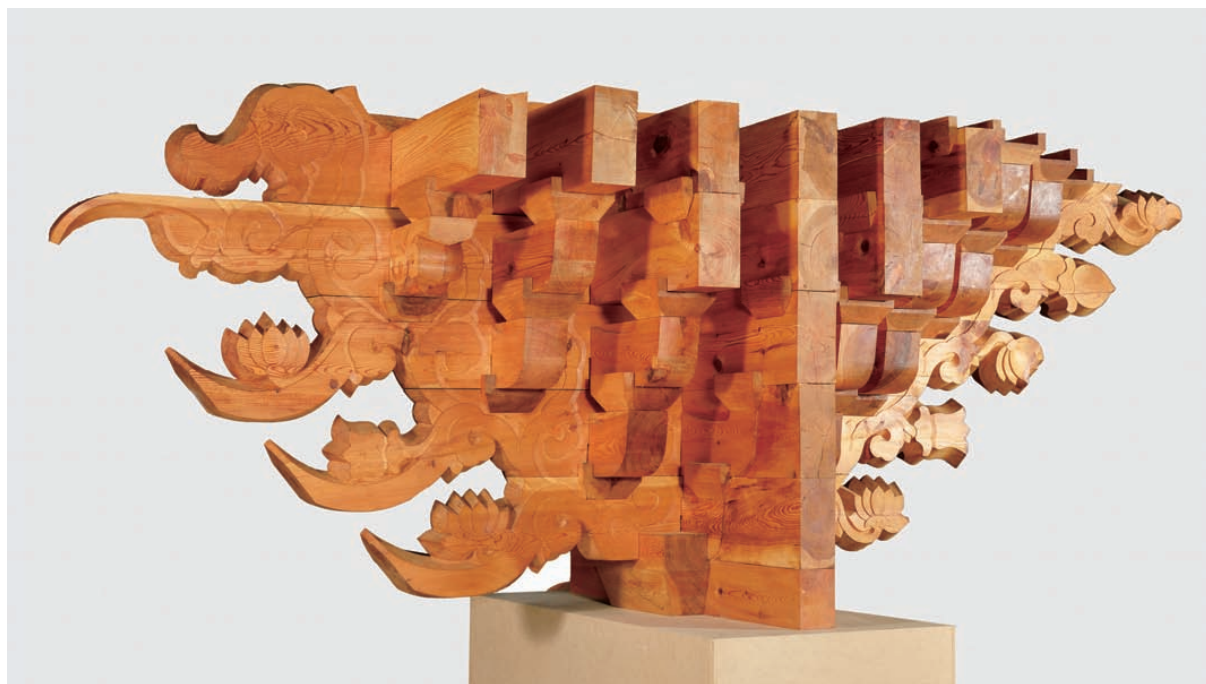
E 救仁寺大祖師殿の組物模型、1/1

申氏が手がけた長さ4mにも及ぶ実寸大組物模型が会場に登場。韓国建築の特徴である華麗な組物彫刻の迫力を伝えます。また宮殿の設計図や内部構造のしくみを伝える建築模型、組物製作に用いる型板、建築儀式も紹介。日本と相通じる隣国の建築文化には数々の新鮮な発見があるはずです。