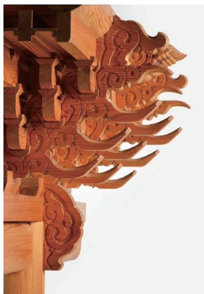
F 勤政殿の組物模型、1/5