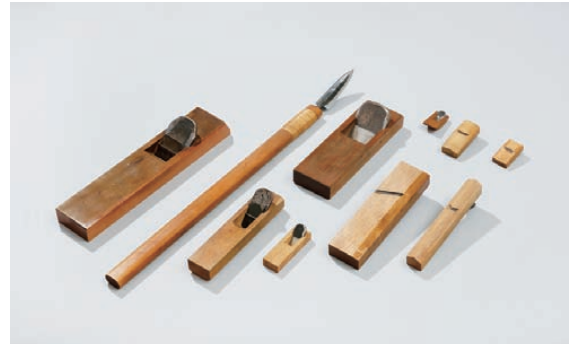
各種の台鉋とヤリガンナ