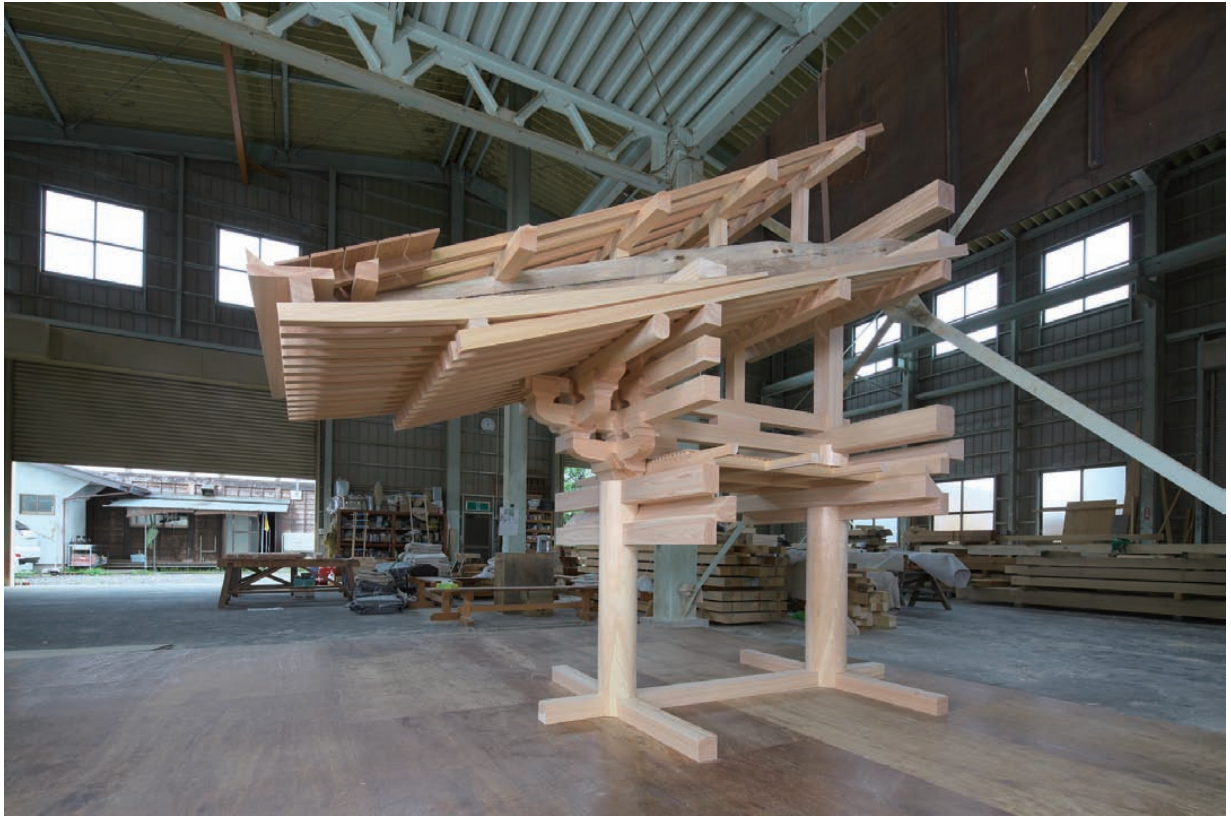
㊦ 薬師寺東院堂の構造模型、1/2

目玉展示は本展にあわせて制作した薬師寺東院堂の構造模型（2分の1）。中国大陸からの文化を取り入れつつ、独自に発達した日本建築の構造美を伝える展示品です。中国や韓国の模型と見比べることで、日本特有な構造の理解も深まります。設計図や型板、大工道具の展示を通して、古代工匠の技に学び、線の美しさを極める小川棟梁のこだわりにも迫ります。