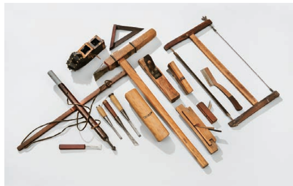
故宮修繕技芸部に伝わる大工道具