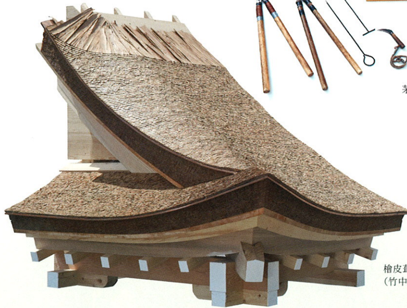
檜皮葺き実物大模型 (竹中大工道具館蔵)