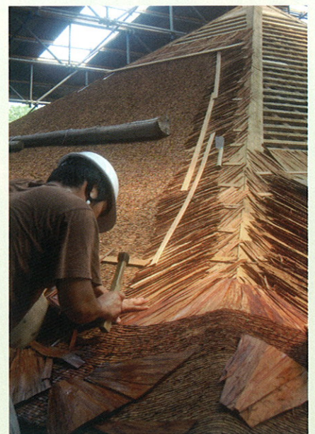
檜皮葺きの様子(映像)