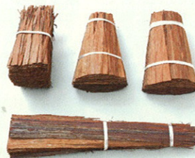
檜皮葺きの材料