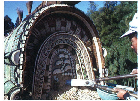
茅葺きの棟仕舞(茨城)

自然と共生する循環型社会の構築が求められる今、本展では環境にやさしい草と木でつくる屋根に焦点をあて、その伝統技術を振り返ります。草でつくる「茅葺き」、ヒノキの樹皮を重ねる「檜皮葺き」、薄く割った板を重ねる「柿葺き」を中心に、それぞれの材料、道具、実物大の屋根模型、そして映像を用いて、茅や檜皮などの材料が屋根となるまでの過程をわかりやすく紹介します。植物屋根の魅力を肌で感じていただければ幸いです。