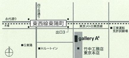
東京メトロ東西線「東陽町駅」下車 東出口3番より徒歩3分

自然と共生する循環型社会の構築が求められる今、本展では環境にやさしい草と木でつくる屋根に焦点をあて、その伝統技術を振り返ります。草でつくる「茅葺き」、ヒノキの樹皮を重ねる「檜皮葺き」、薄く割った板を重ねる「柿葺き」を中心に、それぞれの材料、道具、実物大の屋根模型、そして映像を用いて、茅や檜皮などの材料が屋根となるまでの過程をわかりやすく紹介します。植物屋根の魅力を肌で感じていただければ幸いです。