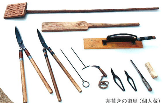
茅葺きの道具(個人蔵)